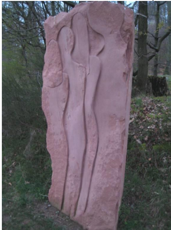
„Die Betrachtenden“ von Kerstin Thiele-Küchle, Schwabmünchen

(Quelle für die obenstehenden Bilder: http://kunstwanderweg.blogspot.com/2008_04_01_archive.html/Walter Böhme )